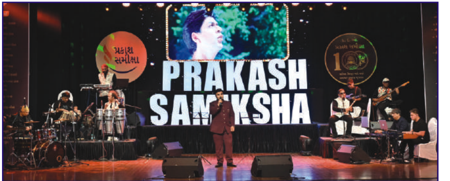
મ્યુઝીકલ ઓરકેસ્ટ્રા : સદાબહાર ગીતોં કા ગુલહસ્તા