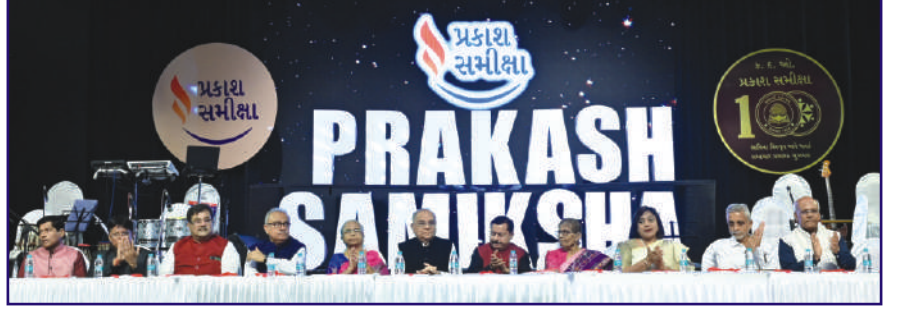
મંચ ઉપર ઉપસ્થિત પ્રકાશ સમીક્ષા ટ્રસ્ટી મંડળ